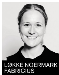
LØKKE NOERMARK FABRICIUS

Den første fortælling kom fra Gladsaxe Kommune, som delte kommunens erfaringer fra byggeriet af Elverdammen – et svanemærket børnehus. Bag beslutningen om svanemærket byggeri lå en forventning om blandt andet øget medarbejder-